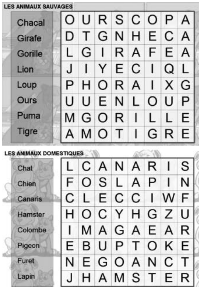
Рис. 2. Приклади карток для команд (зліва – для команди «Левів», справа – для команди «Крокодилів» (за матеріалами Інтернет-ресурсу, режим доступу: http://www.toupty.com/motscaches.php?num=1&nom=animaux-sauvages )

Professeur: Alors on passe au concours suivant. Sur les cartes vous avez «les mots cachés». Trouvez-les le plus vite possible!