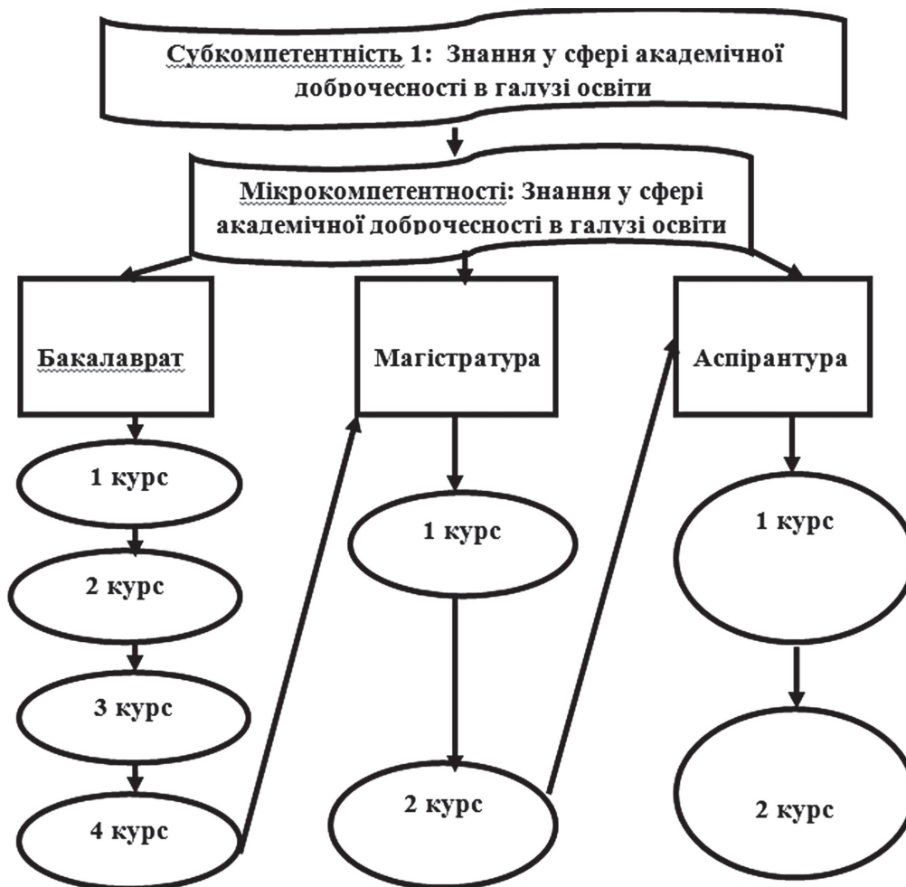
Рис. 2. Структура субкомпетентності здобувачів вищої освіти "Знання у сфері академічної доброчесності в галузі освіти"