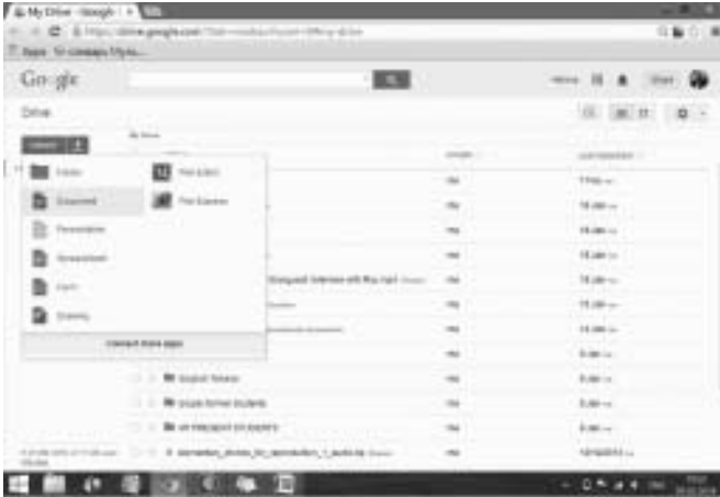
Рис. 2. Скріншот Google Drive