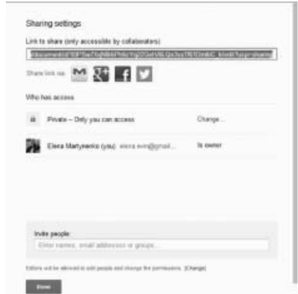
Рис.4. Скріншот Google Drive

Таких робочих документів можна створити безліч, помістивши їх у папки, які створюються аналогічно. Для зручності папки можна створювати за темами, розділами, цілями. Наприклад, “Граматика”, “Лексика”, “Розмовні теми”.