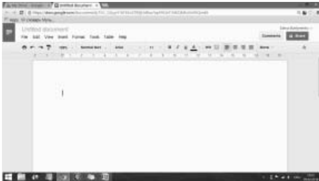
Рис.3. Скріншот Google Drive

Саме у цьому створеному документі викладач і студент викладатимуть домашні завдання, відскановані тексти, списки нових слів — усі робочі матеріали. Принцип редагування такого online документа, такий же, як і програми Word.