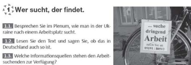
Рис. 7. Фрагмент з підручника «DU 2»

У кожному розділі НМК «DU» студентам надаються також якісні, цікаві та корисні навчальні матеріали для формування процесуального компонента МКК (комунікативно-процедуральні знання і вмін-